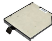
Съемный 3-й SSD- накопитель для медиа- отсека