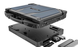
Блок расширения переносной сервер