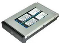
Быстросъемная корзина с SSD накопителем 256ГБ - 1ТБ PCIE